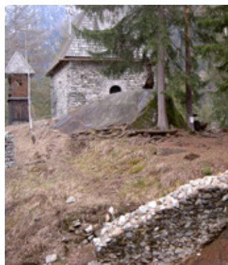
Die Toblkapelle, eine der Stationen der Kulturmeile Tauferer Ahrntal

derheiten des Tauferer Ahrntals im vergangenen Jahrzehnt gerecht zu werden, und den Zugang zu diesen zu modernisieren, wurde das Nachfolgeprojekt – genaue genommen das Leader-Projekt Nr. 063, „Kulturmeile Tauferer Ahrntal – Reloaded“ - in Angriff genommen. Vor kurzem konnte dieses erfolgreich abgeschlossen und auch der neue Kulturführer, der in diesem Rahmen entstanden ist, gedruckt und vorgestellt werden. Er wurde in einer Auflage von 2.000 deutschen und 1.500 italienischen Broschüren den Gemeinden des Tauferer Ahrntals zur freien Verwendung überlassen. Auch die Internetseite wurde neu programmiert ( www.kulturmeile.it ), eine App zur Nutzung auf Smartphones entwickelt, die Verlinkung mit QR-Codes vorgenommen sowie Wartungs- und Verbesserungsarbeiten an den Stationen der Kulturmeile durchgeführt. So kann sich die Kulturmeile Tauferer Ahrntal in ihrem „neuen Kleid“ durchaus sehen lassen! (SH)